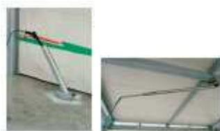
Padlóra szerelt pisztolytartó Forgatható mennyezeti kar